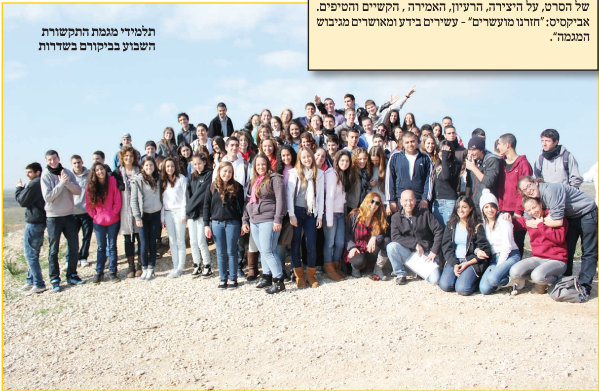
תלמידי מגמת התקשורת השבוע בביקורם בשדרות